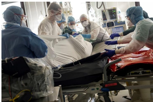
Service de réanimation de l'Hôpital Nord-Ouest Villefranche. Mars 2020.

Les dispositifs de limitation des visites dans les hôpitaux et les EHPAD restent en place et pourront être ajustés afin de réduire le risque de circulation du virus au sein des établissements. Ces mesures sont essentielles pour protéger les patients et les professionnels de santé.